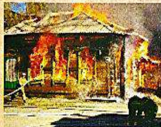
В этом доме в поселке "Урагаль" Ангарского района 2 января 2014 г. при пожаре погибли три детей.